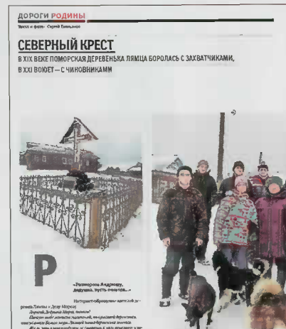
пор от дьячка Изюмова и крестьян («Родина» № 12 за 2017 год).

А в июне 1855 года продолжили свою Беломорскую кампанию, попытавшись высадиться у деревни Лямца. Но получили от-