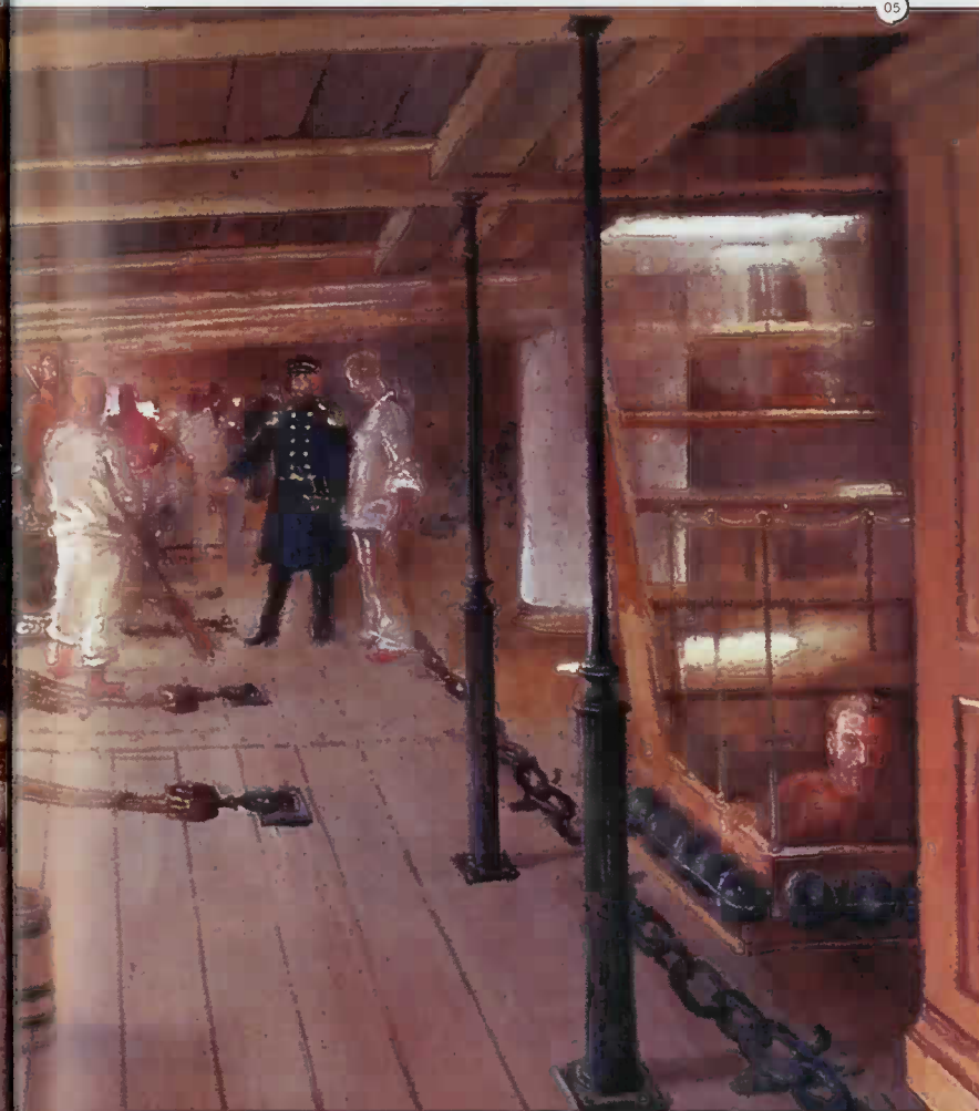
°5 А. Тронь. В батарейной палубе русского линейного корабля времен Крымской войны.