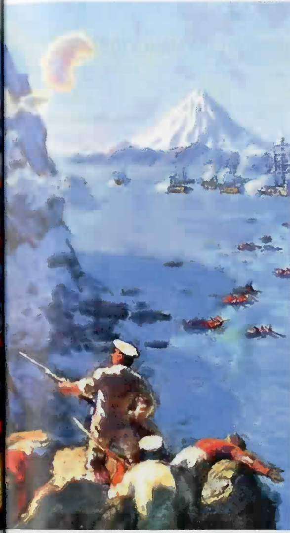
06 Капсюльное ружье образца 1845 года.