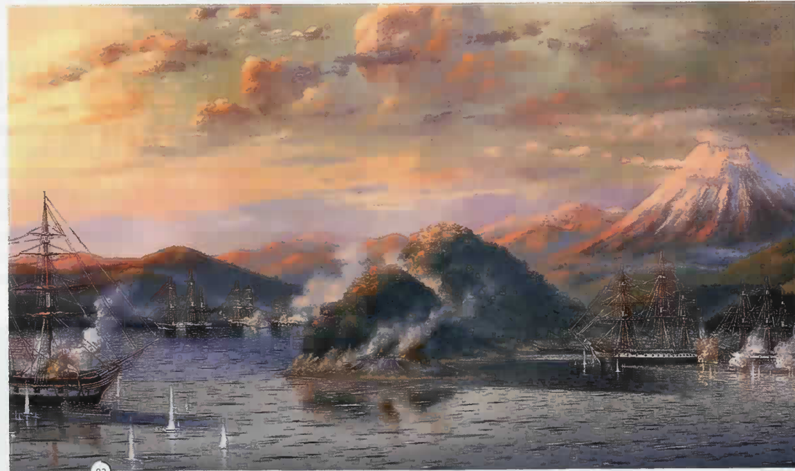
°2 В. Шиляев. Битва за Петропавловск-Камчатский, 1854 год.

порта от Петропавловской губы. (Тем более что русские батареи оказались весьма уязвимы.)