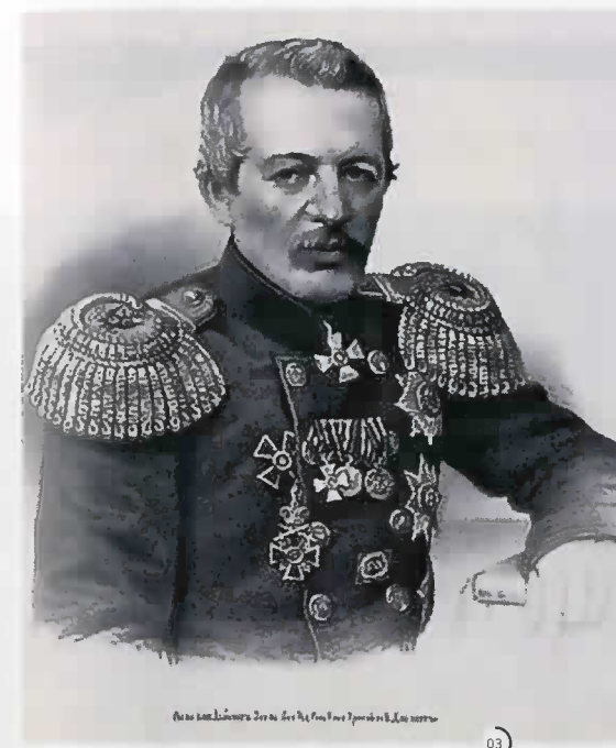
°3 Василий Завойко. 1860 год.