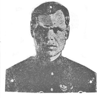
после того, как у партизан истощились последние патроны.